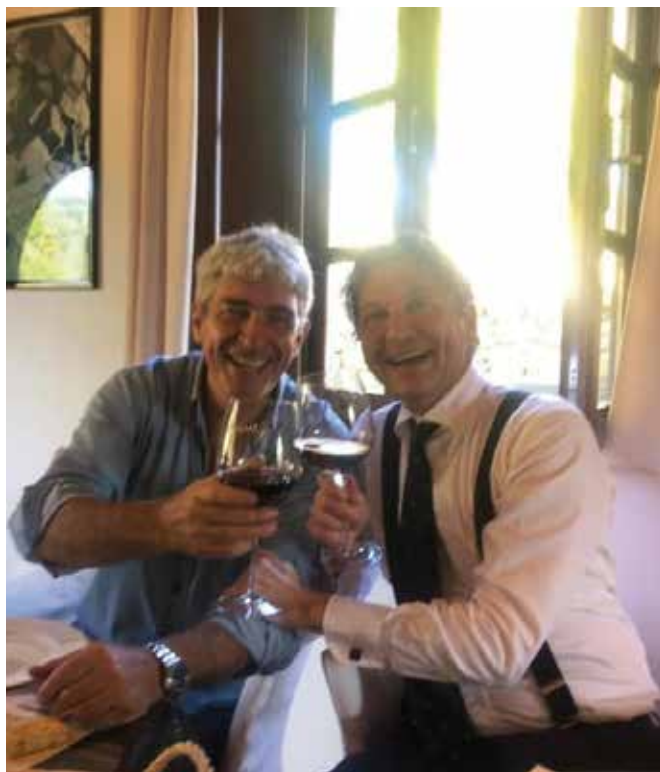
Mario Ciaccia con l'indimenticabile Paolo Rossi

La notevole esperienza maturata negli anni di attività ci ha consentito di acquisire nel tempo radicate capacità in grado di fornire al cliente un'assistenza tecnica di alto livello capace di soddisfare, oltre ogni aspettativa, le esigenze dello stesso.